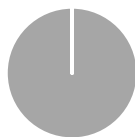
2. Afstemming op taxonomie van beleggingen exclusief overheidsobligaties*